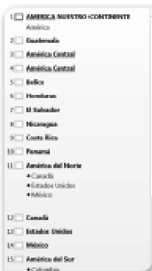
Imagen 4-1: Panel Esquema

El manejo del texto de una presentación es muy sencillo en la Vista Esquema. Esta vista muestra todo el texto que se ha insertado en los marcadores de posición de las diapositivas. Como no se ven los elementos gráficos, colores y demás objetos, el panel Esquema es muy conveniente para editar los textos, modificar la sangría o trabajar con numeración y viñetas.